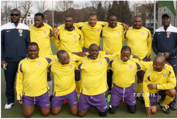
Veteran Flambeau Club Berlin e.V.