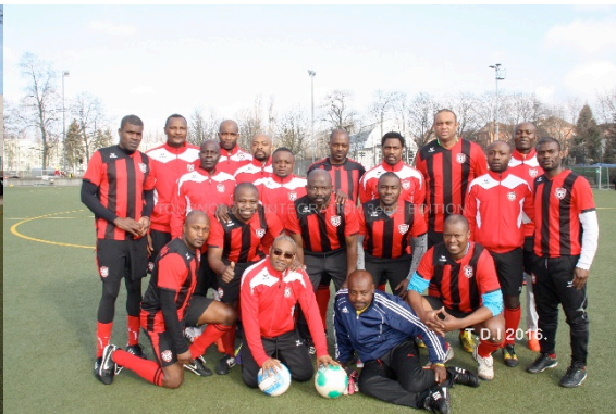
Veteran F.C. Berlin