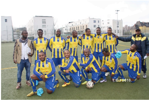
Union Veteran Berlin