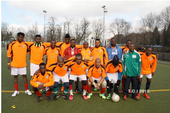
Schiller 2 Zero